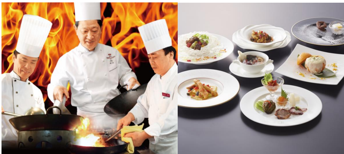
【イメージ写真:「饗宴」スペシャルコース】

中国料理の伝統に三者三様の個性を加味した、はじめての「饗宴」を、ぜひ、この機会にお楽しみください。