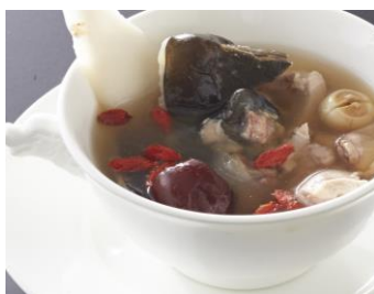
スッポンと丹波地どりの 漢方滋養蒸しスープ