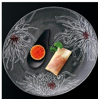
北京ダックとフォアグラタルトの 紹興酒風味