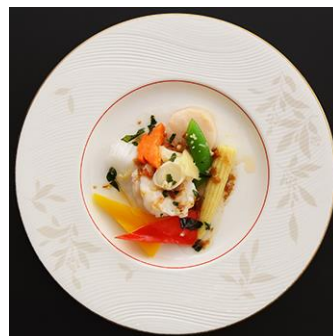
海の幸の泰式 XO 醬炒め