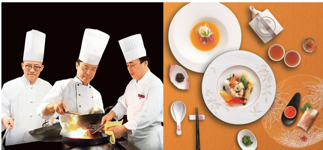
【イメージ写真:「饗宴」スペシャルコース】

本企画は、ANAクラウンプラザホテルで腕をふるう各料理長が、“食”を通し三都を旅しているような気分を感じてもらいたいという思いから実施するもので、好評を得た昨年に引き続き、今年で2回目の開催となります。今回は、京都・大阪・神戸の各中国料理 料理長のスペシャリテ3品を中心に、ホテルごとに個性あふれるコースに仕立てました。中国料理の伝統のうえに三者三様の技を結集させた「饗宴」メニューで三都の味めぐりをお楽しみください。