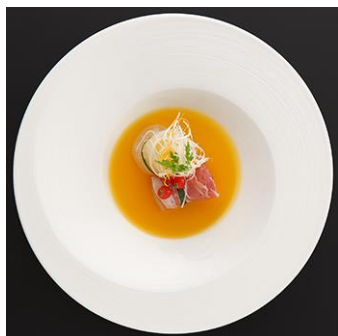
冬瓜のオレンジジュース煮 塩漬け鯛と生ハム巻き