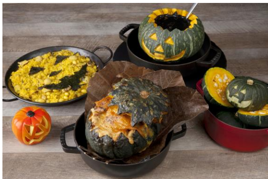
<パンプキンメニュー 3種>

ホテルのレシピにチャレンジするクッキング教室。10月は「パンプキングラタン」に挑戦! シェフと一緒にわくわく楽しい体験を。