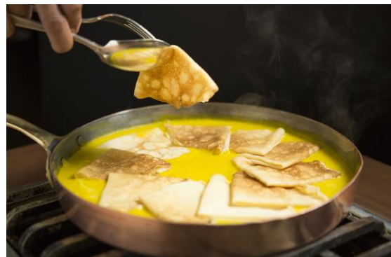
<カボチャのシュゼット>