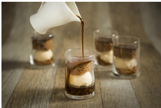
<ヘーゼルナッツとエスプレッソのヴェリーヌ>