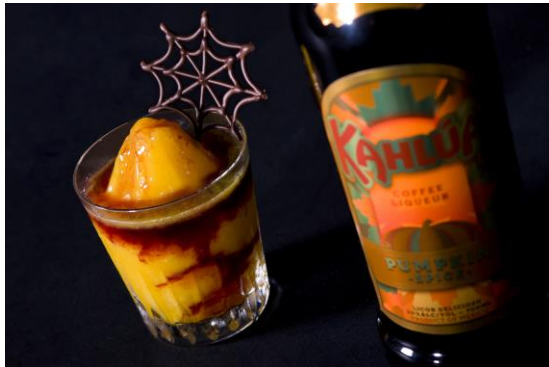
<ハロウインカクテル>

パンプキン風味のカルーアをベースに、カシスリキュールを合わせた芳しい香り漂う一杯。マンゴ어의爽やかな甘みが、濃厚な味わいをいっそう引き立てます。