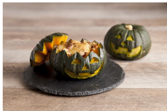
<キッズシェフ (パンプキングラタン)>