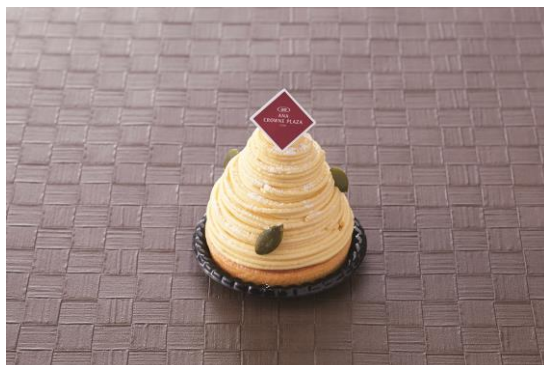
＜カボチャのモンブラン＞