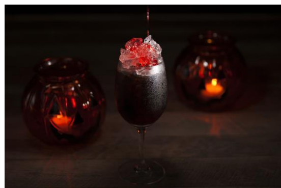
<ブラックカクテル>

ご予約・お問い合わせ 4F カジュアルダイニング ザ・テラス Tel 078-291-1163