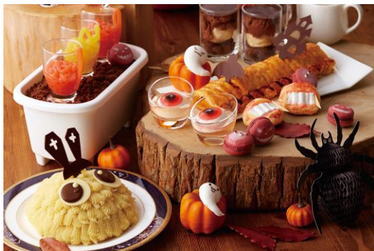
<ハロウィンデザートbuffet>