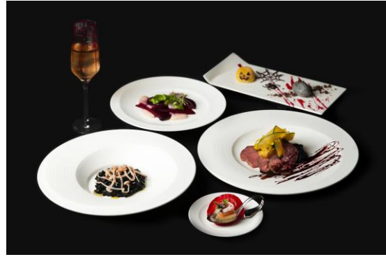
<イベントメニュー>

ご予約・お問い合わせ 36F レストラン&バー Level 36 Tel 078-291-1133