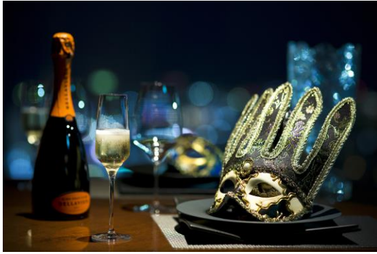
<イベントイメージ>