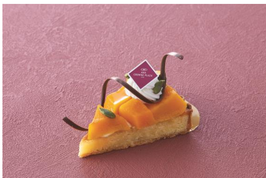
＜カボチャのタルト＞