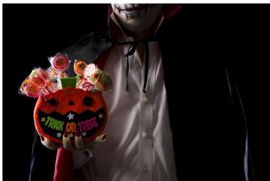
<キャンディをプレゼント>