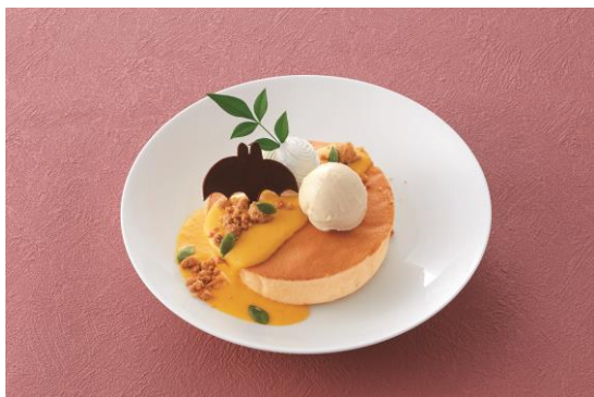
＜カボチャソースとシナモンアイスクリームパンケーキ＞