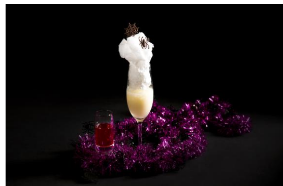
<ハロウィンカクテル「スパイダートルネード」>