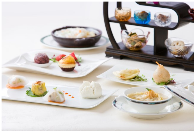
「潘シェフ 点心ランチコース」イメージ